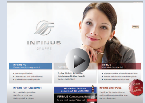
Zur Homepage der INFINUS Gruppe (zum Starten auf das Bild klicken)

Rudolf Ott: Die fondsgebundene Rentenversicherung INFINUS pension alpine ist wie bereits genannt ein weiteres exklusives Produkt der INFINUS Gruppe und daher für alle zugänglich, die eine Courtagevereinbarung mit der INFINUS GRUPPE haben.